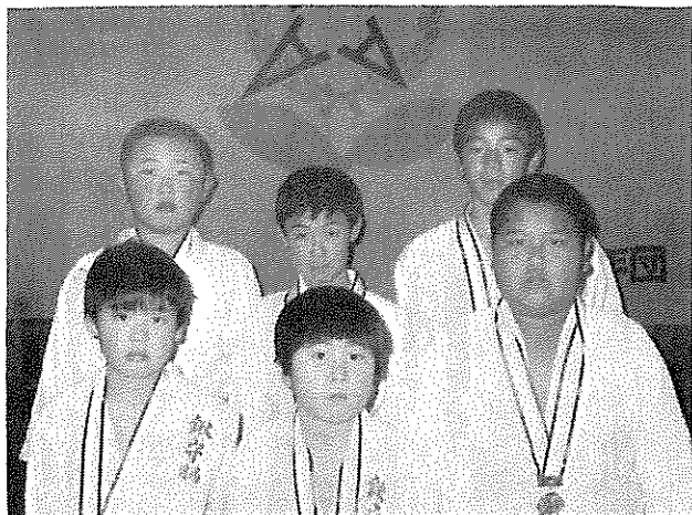
各クラスの入賞者