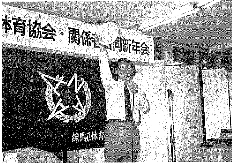
オクションで頑張る本間事業部長