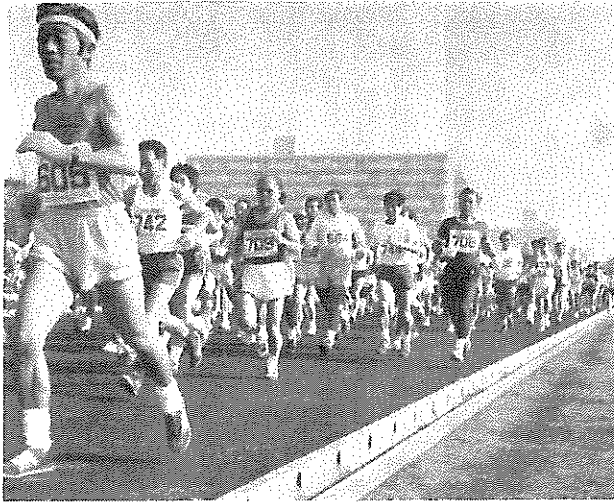
成人10kmロードレース