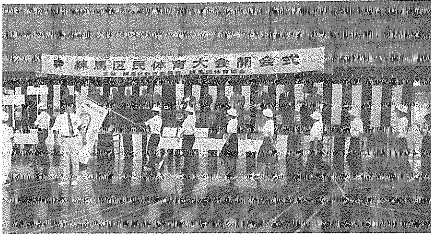
▲ 入場する練馬区スケート連盟選手団

七月十四日、第三十九回区民体育大会の開会式は、区立総合体育館主競技場に於て開催された。