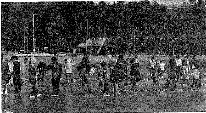
参加十三名 （担当 水野育生）