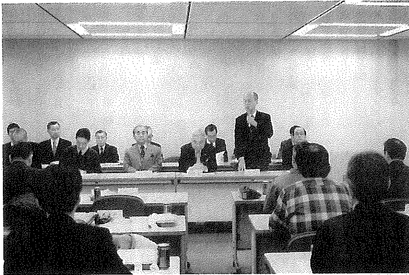
体協総会にて挨拶する岩波三郎練馬区長