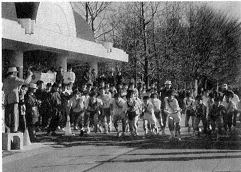
号砲一発スタート