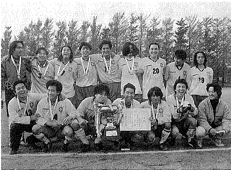
喜びの優勝チーム カナリーオの選手