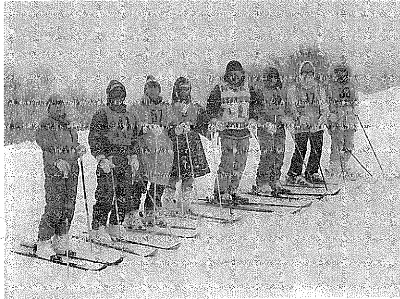
スキー教室参加の皆さん

○高校の部 月日 十月一日～十月十日 場所 都石神井高校 光が丘体育館 参加者 男子 二二〇名 女子 一三〇名 役員 三三名 ・男子 優勝 早大学院高等学校 二位 石神井高等学校 三位 練馬高等学校 ・女子 優勝 富士見高等学校 二位 第四商業高等学校 三位 光が丘高等学校 ○中学生の部 月日 八月二十八日～九月十五日 まで 参加者 男子 二二一名 女子 七五名 役員 四三名 ・男子 優勝 石神井東中学校 二位 大泉北中学校 三位 北町中学校 ・女子 優勝 石神井南中学校 二位 貫井中学校 三位 光が丘第四中学校 ○小学生の部 月日 十一月十五日～十一月二十三日 まで 場所 光が丘体育館 参加者 男子 三三〇名 女子 二二〇名