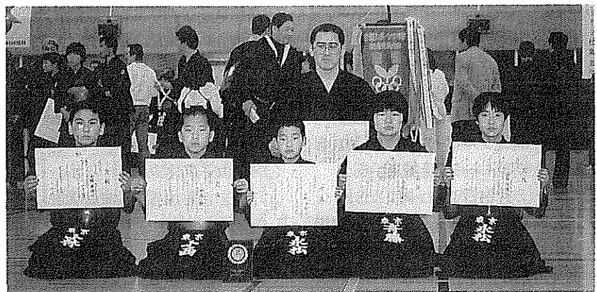
敢闘した 東京都団体戦選手団