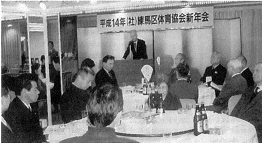
挨拶する 岩波三郎 練馬区長