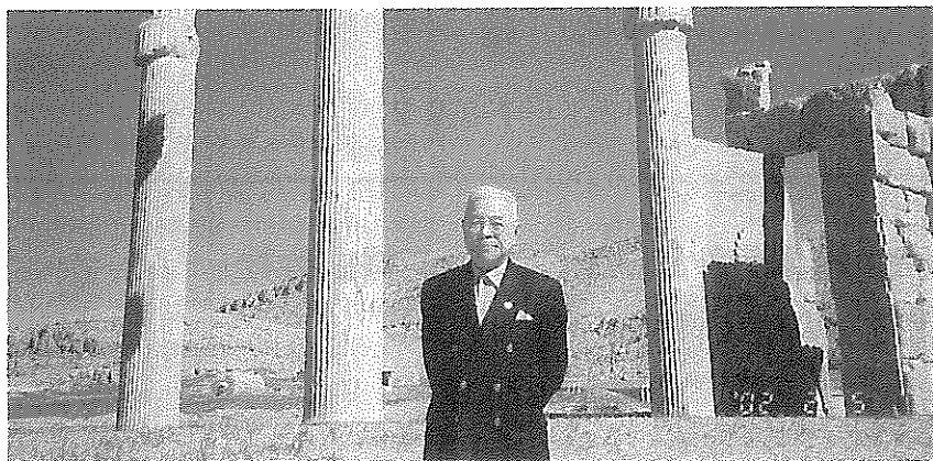
イラン ペルセポリスの大遺跡にて 筆者

翌4日、第二の訪問都市「シラーズ」に飛んだ。地元関係者の案内で市内の関係施設を視察、5日朝より車にて最大の目的地である「ユネスコの世界遺産として有名なペルセポリス」に向かう。紀元前512年頃ペルシャのダレイオス一世、その子のケセルクス王によって完成された12万キロ平米の宮殿です。しかし200年後、アレキサンダー大王に攻められ廃墟と化したその遺跡なのです。空高くそびえる正