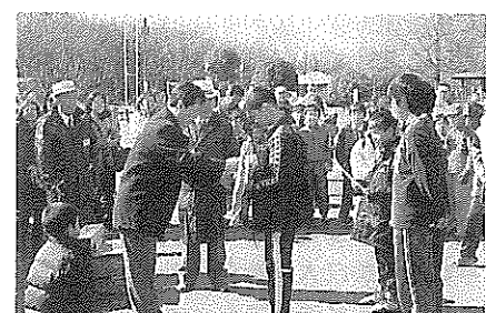
小学生の部 表彰式