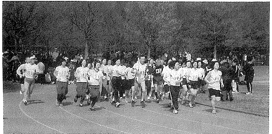
朝日をあびて ロードレースの選手たち

まれ、競技開始。しかし中途から温かい風が吹き乾燥した砂塵がときどき舞い上り目をおおったが順調に競技が終了した。