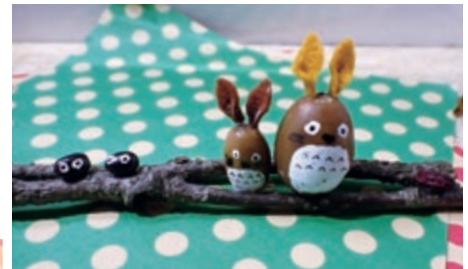
どんぐりや木の実で作成