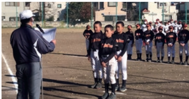
学童野球新人戦閉会式