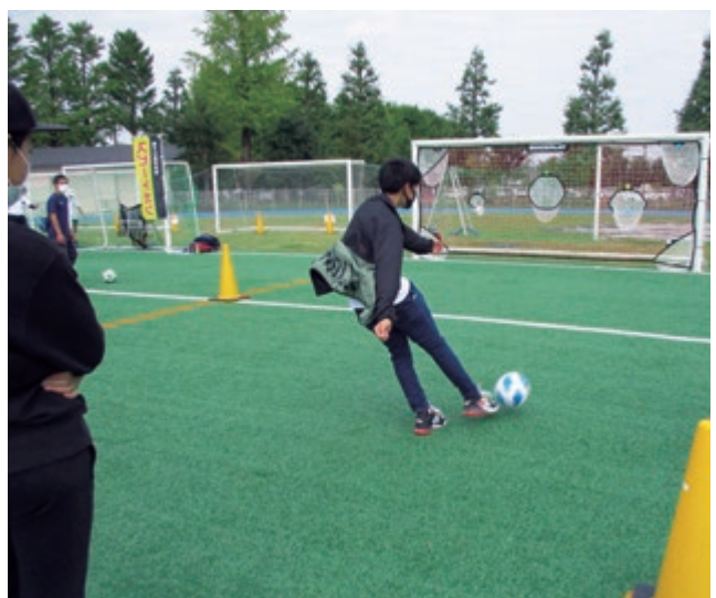
キックターゲット