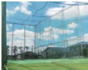
75ヤードのゴルフ練習場