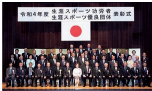
生涯スポーツ優良団体表彰受賞