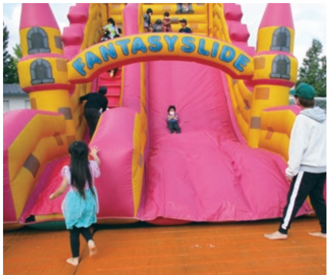
体協スライダー体験