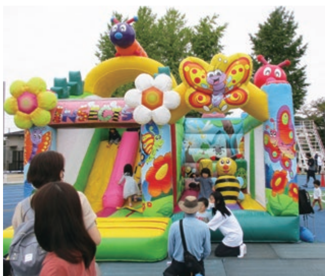
体協アスレチック体験