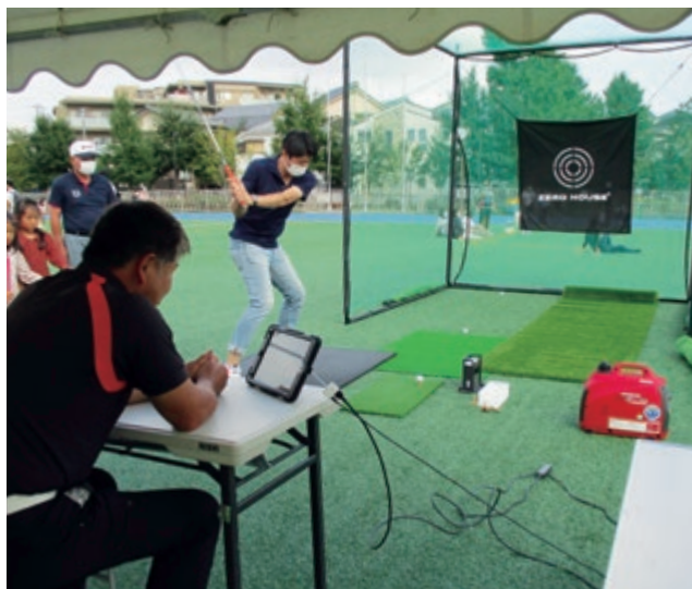
ゴルフ飛距離計測