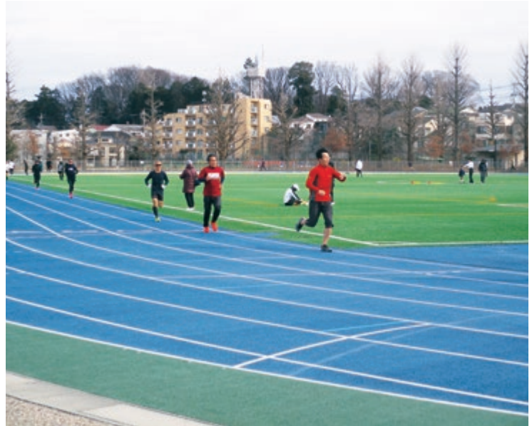
総合運動場一般開放の様子（陸上トラック優先時間）

ご利用の際は、練馬区ホームページに一週間の競技場利用状況(毎週火・金曜日更新)や利用ルール等が掲載されていますので、ご確認ください。